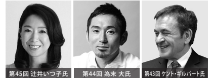
過去の交流大会の講師

日本の教育をより良いものにするためには、家庭と学校と地域との本音の連携が大切ではないでしょうか。現在の教育の諸問題を考えたときに、日本人が今まで大切にしてきた道徳的価値や日本の伝統文化に対する誇りを、次代を担う子供たちに伝えていくことが最も重要であると考えています。また、私たちはこの教育交流大会を、保護者と教師、地域の方々がこれからの教育について、ともに考えを深める場として有意義なものにしたいと考えています。「教育再興を福岡の教育から」これが私たちのテーマです。この教育交流大会を契機に、私たち福岡教育連盟の活動をご理解いただくことができれば幸いです。